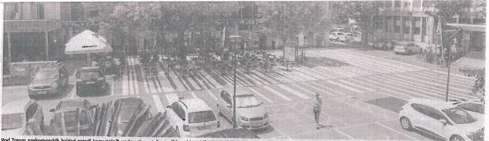
Pod Trgom prekomorskih brigad zaradi komunalnih vodov ni mogoče graditi parkirne hiše. Je pa občina predlagala, da bi parkirno hišo lahko zgradili na območju bližnje zelenice pod pogojem, da se parkiranje na Trgu prekomorskih brigad ukine. Luka Cjuha